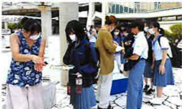
保護者からの 熱いエール