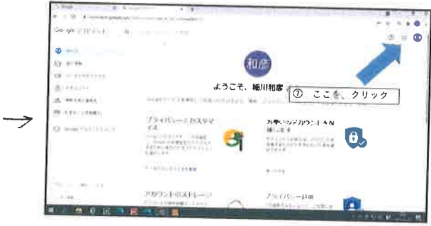
1. ☰ をクリック (右上)