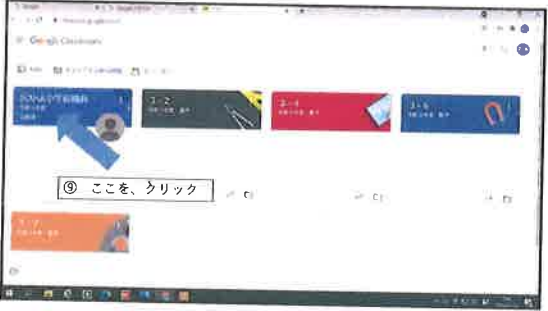
3. 自分の授業(教科)をクリック