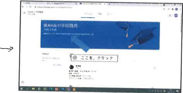
4. Meetのリンクをクリック