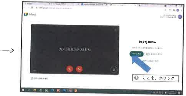
5. 今すぐ参加をクリック