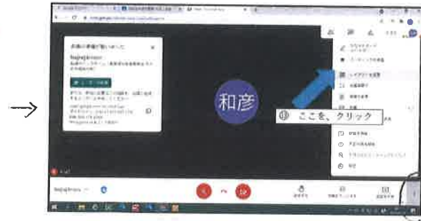
7. ☰ をクリックし、レイアウト変更 (右下)